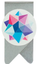
wingclip | 04