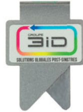
wingclip | 02