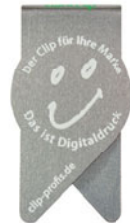
wingclip | 04