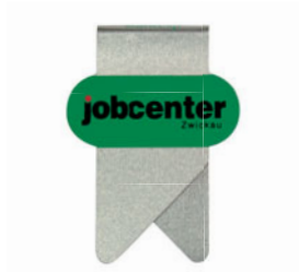
wingclip | 01