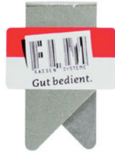
wingclip | 02